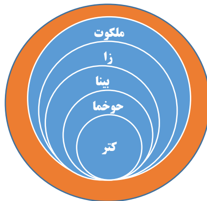
نمودار شماره ۳- رابطه پنج سفیرای اصلی

در جهان بینی زُهری ده سفیروت وجود دارد؛ با توجه به اینکه هر سه سفیروت کتر، خوخما و بینا شامل بقیه سفیراها هم هستند، علاوه بر اینکه سفیراها با یکدیگر اتحاد و زوجیت دارند؛ هر سفیرا، شامل ویژگی‌های بقیه سفیراهاست و شامل بخش‌هایی از آن‌ها می‌شود. بنابراین، هر سفیرا شامل کتر، خوخما، بینا، زا و ملخوت هم می‌شود.