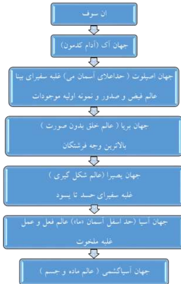
تصویر شماره ۵- جهان های چندگانه